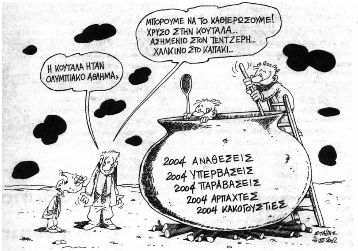
Σκίτσο του Στάθη - ΕΛΕΥΘΕΡΟΤΥΠΙΑ 27/11