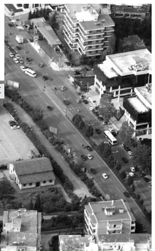
ΔΑΣΟΣ ΣΥΓΓΡΟΥ - ΣΥΝΟΡΑ ΜΕ ΚΗΦΙΣΙΑΣ